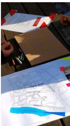
Mit einem Plan durch unsere schöne Stadt

„Wir waren bei dem Ausflug. Der hat besonders Spaß gemacht. So eine Frau hat uns viel über den Main erzählt. Sie hat uns gesagt, dass es den Main früher nicht gab. Sie hat uns auch gesagt, dass bei dem Main früher eine un stabile Brücke war. Wir haben was über den Grafen erfahren und über die Gebrüder. Wir sind auch im Rathaus bis zum letzten Stock gefahren und haben da gefrühstückt.“