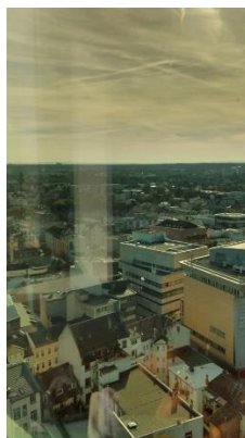
Offenbach von gaaaanz oben!